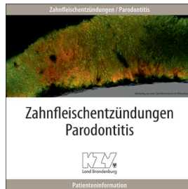
Zahnfleischentzündungen / Parodontitis