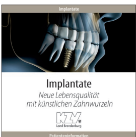
Implantate - Neue Lebensqualität mit künstlichen Zahnwurzeln