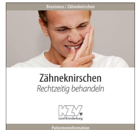
Bruxismus / Zähneknirschen - Rechtzeitig behandeln