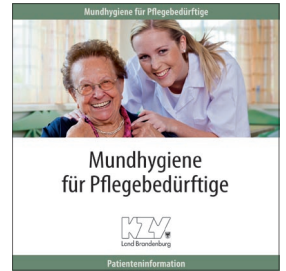
Mundhygiene für Pflegebedürftige