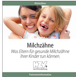
Milchzähne - Was Eltern für gesunde Milchzähne ihrer Kinder tun können.