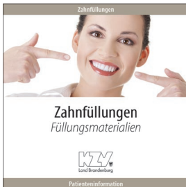
Zahnfüllungen - Füllungsmaterialien