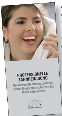
Professionelle Zahnreinigung - als Beilage zu Vorsorge-Recalls und als Praxisinformation