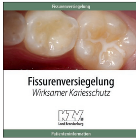
Fissurenversiegelung - Wirksamer Karieschutz