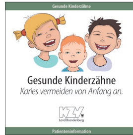
Gesunde Kinderzähne - Karies vermeiden von Anfang an.