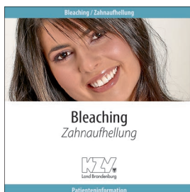
Bleaching - Zahnaufhellung