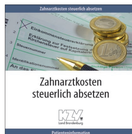
Zahnarztkosten steuerlich absetzen