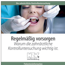
Die zahnärztliche Kontrolluntersuchung