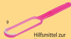
9 Hilfsmittel zur Zungenreinigung