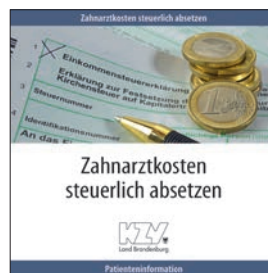
Zahnarztkosten steuerlich absetzen