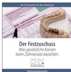
Der Festzuschuss - Was gesetzliche Kassen beim Zahnersatz bezahlen.