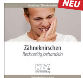
Bruxismus / Zähneknirschen - Rechtzeitig behandeln