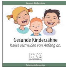
Gesunde Kinderzähne - Karies vermeiden von Anfang an.