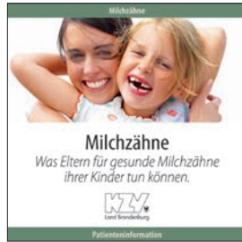
Milchzähne - Was Eltern für gesunde Milchzähne ihrer Kinder tun können.