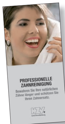
Professionelle Zahnreinigung - als Beilage zu Vorsorge-Recalls und als Praxisinformation

Packungsgröße: 50 Stk. Preis: 9,00 EUR / 50 Stk.