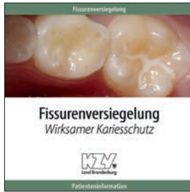
Fissurenversiegelung - Wirksamer Karieschutz