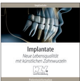
Implantate - Neue Lebensqualität mit künstlichen Zahnwurzeln