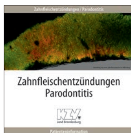
Zahnfleischentzündungen / Parodontitis