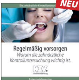
Die zahnärztliche Kontrolluntersuchung