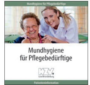
Mundhygiene für Pflegebedürftige