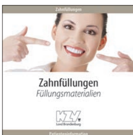
Zahnfüllungen - Füllungsmaterialien